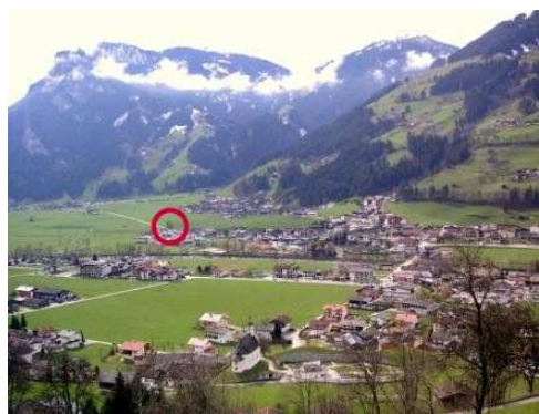
Ansicht vom Ramsberg Richtung Schwendau, Kleinschwendberg (von Nordost Richtung Südwest)