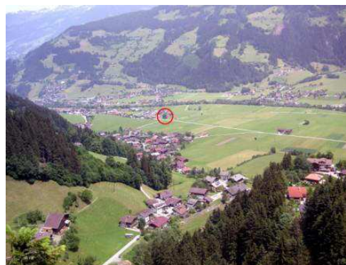
Ansicht vom Kleinschwendberg Richtung Ramsberg (von Südwest Richtung Nordost)