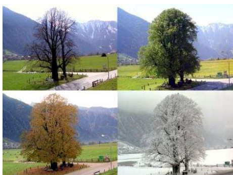
Der Startpunkt "Drei Linden" im Jahresverlauf